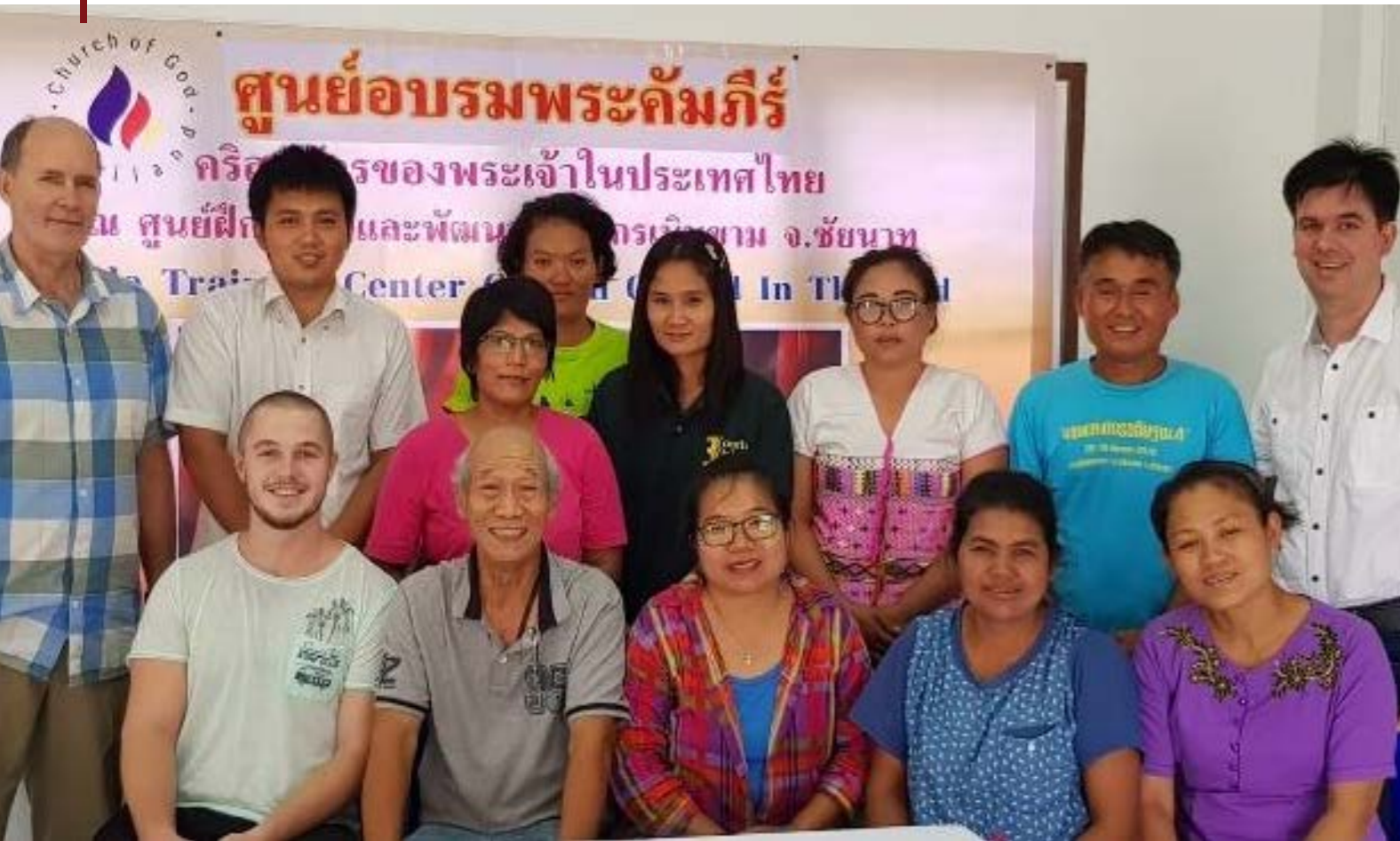
Onze Bijbelschool op de Gemeente-boerderij