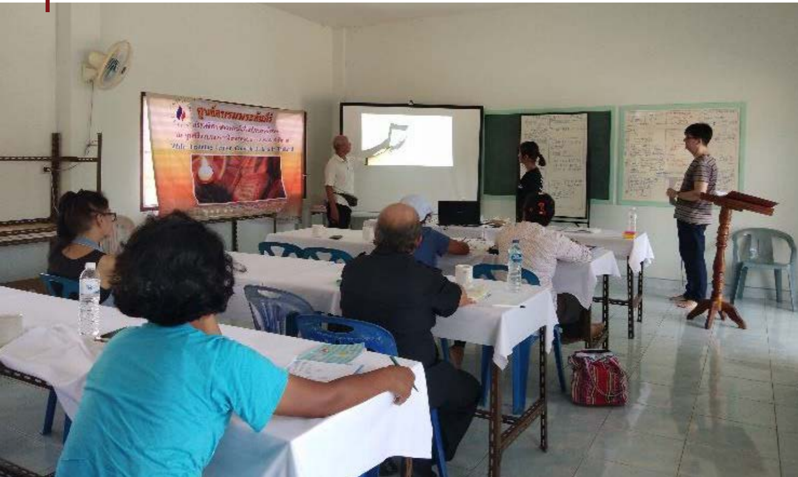
Les geven bij hoge temperaturen